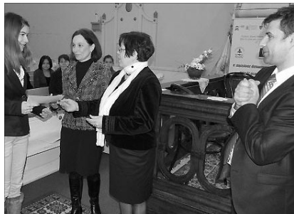
Jó eredményekkel szerepeltek református iskoláink