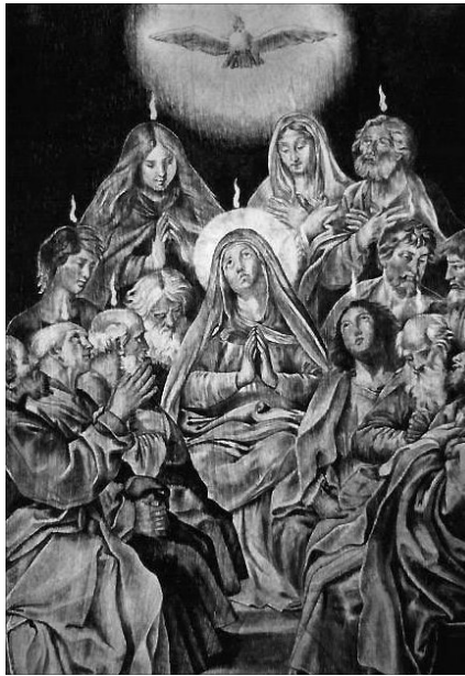
„Együtt várakoztatok, amíg számotokra eljön a vigasztalásnak ama Lelke!”

Hol az esélye és reménye annak, hogy ez a vakbuzgó írástudó tanítvány valaha is a tisztánlátás gyermeke lehet? De – bármennyire különösen hangzik – ugyanez a kérdés feszít bennünket is! Kitaposott, jól bejárt életutakon futnak napjaink. Szokásaink, mint láthatatlan, de alig leoldható belső bilincsek, naponta gátolnak meg abban, hogy új lelki látás birtokosaiként magasba tekintő