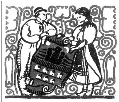
Kós Károly alkotása

ják egymás között. Meg kell értetnünk, hogy a magasból érkező (transzcendens) hang azt ígéri, hogy „még gyűjtök azokhoz, akiket összegyűjtöttem”. Vajon az egyházak, a lelkészek mennyire vállalják még ezen üzenet igazságának hirdetését, és mennyire van hitele szavuknak a hallgatók között. Meg kell értenünk, hogy minden más közösségépítőnek ugyanúgy ilyen értelemben kell egymás mellé támogatnia a nemzet tagjait a szülőhely (immanens) világában. A velünk és általunk működő hit egyszerre megnyitja a titokzatos eget, és erőt fakaszt a hétköznapiak, majd ünnepek világának megélésére. Nem lehet a közös hit és azonos küzdőtér birtoka nélkül világos, egészséges közösségi öntudatot kialakítani. Már pedig e nélkül nincs erkölcsi erő. Nem lehet tovább nyomorogni különutas magánakcióval a