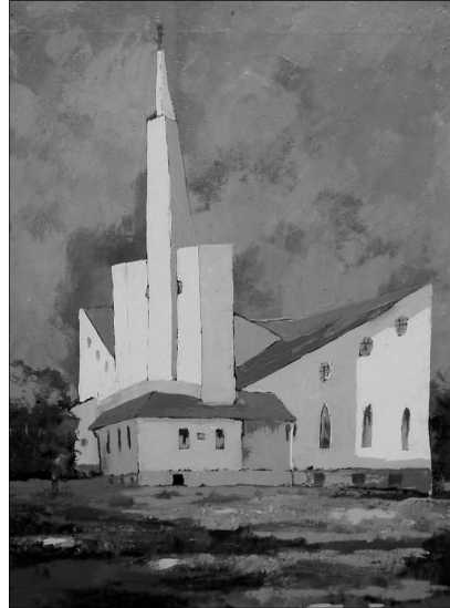
Kovács Lajos Emil: A Bethlen-téri templom, Szatmárnémeti

Ifjaink jelen vannak-e a gyülekezetben, hallgatják-e a tanítást, vesznek-e úrvacsorát, mint Euthikosz? Kitartanak-e az igehallgatásban, mint Euthikosz? Észrevesszük-e őket, örülünk-e nekik, vagy csak kifogásoljuk azt, hogy elaludtak?