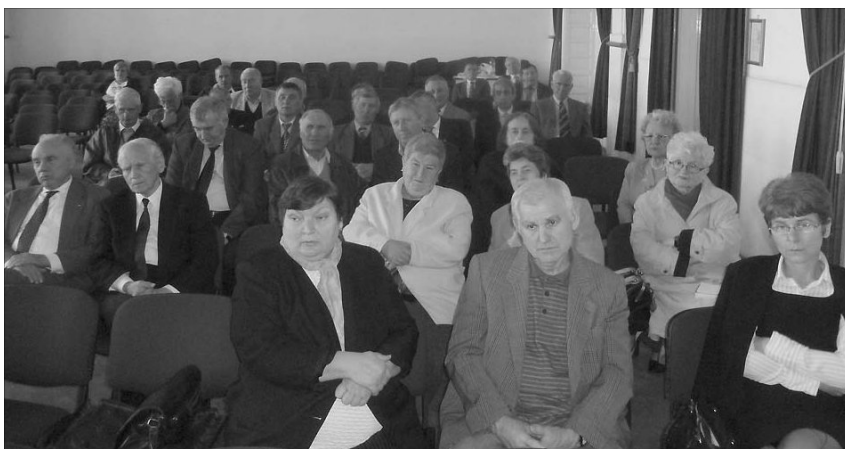
Lugosra várják a nyári, kerületi szintű presbiteri konferencia résztvevőit

Nagyváradon a püspöki palota díszterme adott otthont a Királyhágómelléki Egyházkerület Presbiteri Szövetsége közgyűlésének április 20-án, szombaton.