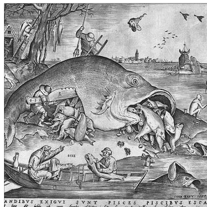
Pieter Bruegel: A nagy hal megeszi a kis halakat című rézmetszete

hát az örök sirám, panasz, ezerfelé fújt zokszó és fusztrációjának több mint látványos megélése.