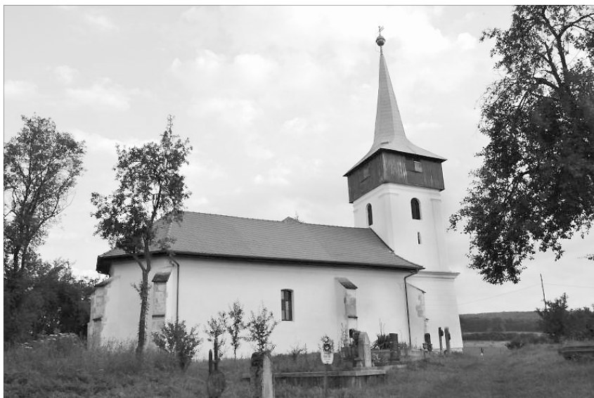
Szilágfőkeresztúr református temploma nagyrészt őrzi a középkori szerkezetét

ban a Nemzeti Kulturális Örökség Minisztériumának támogatásával megtisztították és konzerválták a megmaradt felületeket.