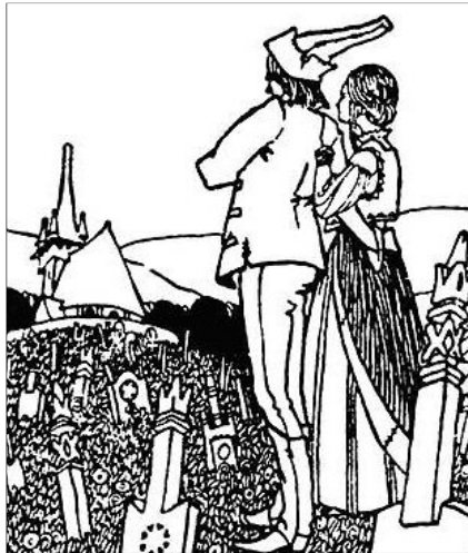
„Honfoglalói öntudattal éljük mindennapunkat”. Kós Károly alkotása

Felvállaljuk a Kiáltó Szó üzenetét, viszont kiegészítjük azzal, ami hitünk szerint a jelen-