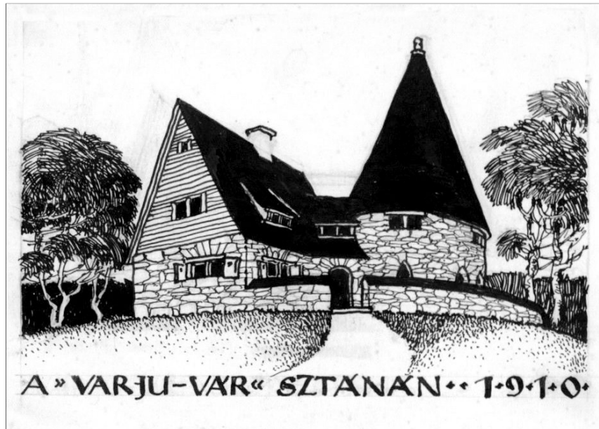
Kós Károly alkotása

Krisztus szava, megjelenése e mai napon is porig alázhat minket, földre kényszerí-