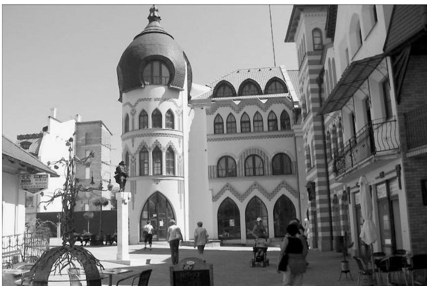
Az Európa-udvarban minden ház a kontinens egy-egy országának építészeti stílusát idézi

Komárom, amelynek északi része Révkomárom, már az árpád-házi királyok idejében ismert volt, kiváltságait IV. Béla királytól kapta 1265-ben. Kiterjedt várrendszerrel rendelkezik – a 16. században épült az Öregvár, a 17. században az Újvár. A 18. században a gabonakereskedelem és a céhes ipar központjává vált. A 19. században folytatták az erődrendszer kiépítését, és híveink tudják, hogy 1849-ben Klapka György tábornok sikeresen védte a komáromi várat. Napjainkban az erődrendszert a