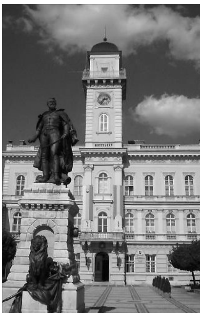
Klapka György egész alakos szobra a város főterén. A városháza tornyából minden délben megszólal a Klapka-induló

Komárom, amelynek északi része Révkomárom, már az árpád-házi királyok idejében ismert volt, kiváltságait IV. Béla királytól kapta 1265-ben. Kiterjedt várrendszerrel rendelkezik – a 16. században épült az Öregvár, a 17. században az Újvár. A 18. században a gabonakereskedelem és a céhes ipar központjává vált. A 19. században folytatták az erődrendszer kiépítését, és híveink tudják, hogy 1849-ben Klapka György tábornok sikeresen védte a komáromi várat. Napjainkban az erődrendszert a