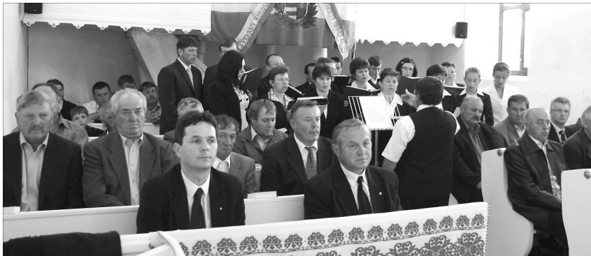
Kisrégiós közösségformálás. Egytértettek a közös teherhordozás szükségességével

Amikor konferenciáról hallunk, valami nagyon tudományos dologra gondol az ember, ahol szakavatott tudós személyek tartanak beszédeket. A Szilágysomlyói Egyházmegyében szervezett Regionális Presbiteri Konferencia a közösségformálást használta fel arra, hogy a mai egyházat mai kérdések mentén próbálja továbbvezetni.