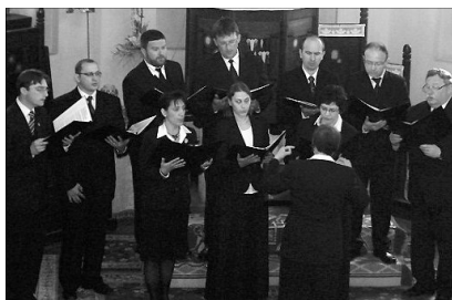
Jövőre a bihariak fogadják az erdélyi lelkészkorúkat