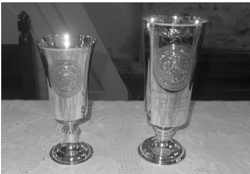
Új ezüst serlegekkel pótolták a két évtizede ellopott kegszereket a misztótfalusi gyülekezetben