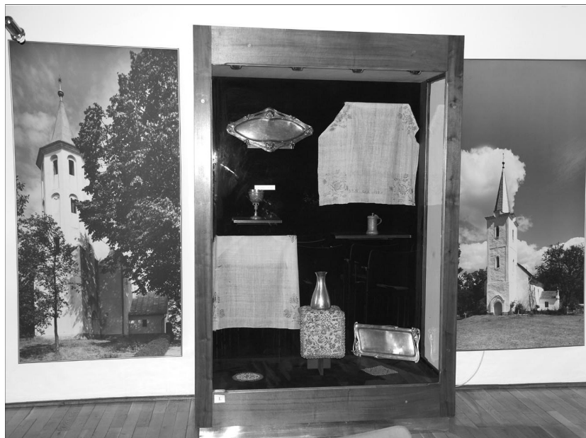
Mecénások öröksége. Országos szinten is egyedülálló a Partiumi Református Múzeum

A Királyhágómelléki Egyházkerület és a Nagyvárad-Olaszi Egyházközség közösen hozták létre az országos szinten is egyedülálló Partiumi Református Múzeumot, melynek gondolata a várad-olaszi lelkésztől származik, s mely a Lorántffy Zsuzsanna Egyházi Központ épületében kapott helyet.