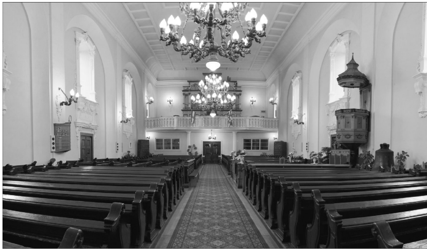
A Heidelbergi Káté 450. évfordulóján tartandó konferencián központi szerepet kap a hitvallás szerepe. Képünkön a helyszín: a szatmárnémeti Lános-templom

Szeretettel meghívjuk a Nőszövetségeket, egyházkerületünk asszonyait és leányait a Királyhágómelléki Református Nőszövetség XIV. konferenciájára, amelyet 2013. július 20-án a Szatmárnémeti Lános-templomban tartunk (Jean Calvin tér).