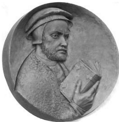
Méliusz Juhász Péter domborműve

Melius Wittenbergben a magyar diákok egyesületének, a coetusnak a vezetője, seniora volt. Bizonytalan, hogy 1557-ben vagy csupán 1558-ban jött e haza. Az is felmerül, hogy amennyiben 1558-ban tért haza, akkor wittenbergi diáktársához, Károlyi Gáspárhoz hasonlóan, netalán vele együtt nem látogatott-e ő is más egyetemeiket, nevezetesen nyugati városokat. 1558 döntő jelentőségű év volt Melius életében, mert akkor tette meg Debrecen plébánosává a város földesura, Enyingi Török János. Debrecen az akkori Magyarország legnépesebb, mintegy 15 ezer, színmagyar lakosú mezővárosa volt. A három részre szakított országban Erdély területéhez tartozott. Buda 1541-ben a törökök által történt