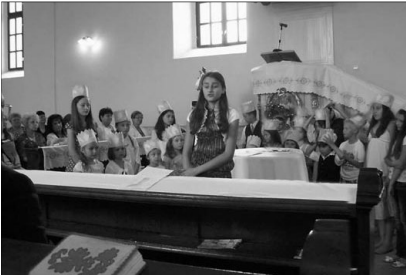
Szinérváraljai gyülekezeti nap