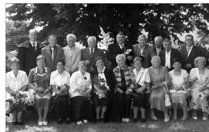
Érmihályfalva: korfirmáltak találkozója