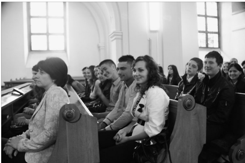
A közösségtől eltávolodott fiatalokat újra közel kell hozni a gyülekezeti élethez

Istennek hála, a Nagybányai Egyházmegyében a nyár folyamán, immár második alkalommal sikerült megszervezni, az egész egyházmegye fiataljait megszólító ifjúsági istentiszteletet. Az első alkalomnak, amely még kísérleti jelleggel, tavaly novemberben volt megrendezve, a vámfalui egyházközség adott otthont.