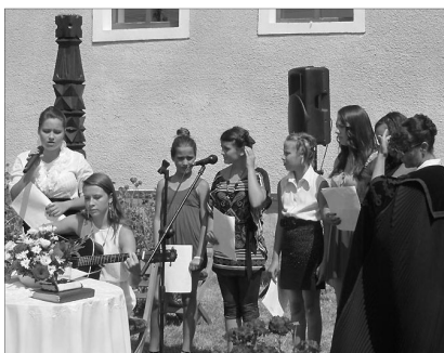
A kakucsi ifjak szolgálata

✿ FELHÍVÁS SZOMBATI-SZABÓ ISTVÁN SZAVALÓVERSENYRE. A Lugosi Református Egyházközség október 5-én (szombaton) kilencedik alkalommal hirdeti és rendezi meg a szavalóversenyt, nem hivatalos versmondók számára, a következő benevezési kategóriákban: 1. elemi iskolák I–IV. osztályos tanulói, 2. általános iskolák V–VI. osztályos tanulói, 3. általános iskolák VII–VIII. osztályos tanulói, 4. középiskolák IX–XI. osztályos tanulói, 5. középiskolák XII. osztályos tanulói – egyetemi hallgatók, 6. felnőtt korosztály.