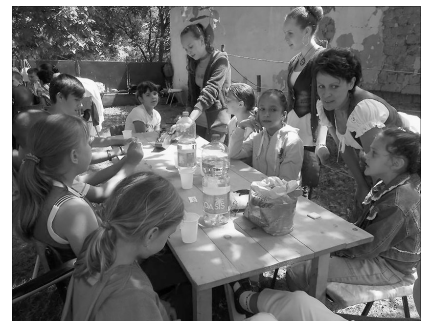
Kiscsoportos tevékenység Diószegen