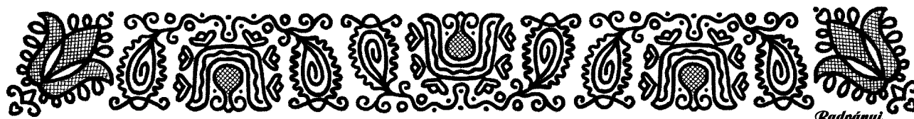
A Radványi-stílusú számon tartott népies motívum a 2007-es falnaptárból