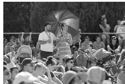
Mezőtúr: Partiumiak a Csillagponton