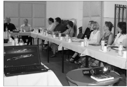
Az Ige vonzásában. Ökumenikus fesztívmiszió

✿ KATOLIKUS SAJTÓNAP: EVANGÉLIUMOT A MÉDIÁBA. A média nem vész el, csak átalakul – ezen a címen tartottak médiánapot az új kommunikációs eszközök alkalmazásáról és megértéséről a Nagyvárad-i Római Katolikus Püspökség szervezésében. Az egyházmegye Laikusképző Központjában a téma iránt érdeklődő papok és egyházi munkatársak, valamint egyházi és világi újságírók gyűltek össze, június 22-én. A média eszközeinek felhasználásával hozzájárulhatunk az örömhír továbbadásához, nem feledve, hogy az a hivatásunk, hogy megismertessük Isten szeretetét – hangsúlyozta nyitó szavaiban Böcskei László megyéspüspök.