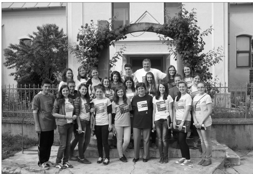
Ifjak szolgálata a krisztusi szeretet jegyében. „Felvállaltuk, hogy mi is az Úr szolgálatában állunk”

„Ne csak szóval szeressünk, hanem cselekedettel és valóságosan.” (1Jn 3,18) – hangzott az idei Kárpát-medencei református önkéntes napok mottója, amely a szilágyballai református ifjúságot immár másodikjára hozta lázas készülődésbe. Az elmúlt év tapasztalatai, élményei alapján úgy gondoltuk, hogy idén még több emberhez igyekszünk eljutni.