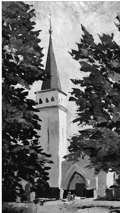
Kovács Lajos Emil: Kültelki református templom, Szatmárnémeti

„Kérlek azért az Isten és Krisztus Jézus színe előtt, aki ítélni fog élőket és holtakat az ő eljövetelekor és az ő országában, hirdesd az ígét, állj elő vele alkalmas és alkalmatlan