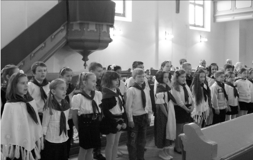
Az érmihályfalvai Bernáth József Református Iskola növendékei

„...és nagy szegénységükből a tisztaszívűség gazdasága lett.” (2Kor 8,2b) Ezt a dicséretet Pál apostol a filippi és a thesszalonikai, a Macedóniában élő keresztyénekről írta. Pál őket azért nevezte tisztaszívűségben gazdagoknak, mert abból a kevésből, amijük volt, őszintén, szeretetből, önzetlenül, Isten iránti hálából adtak a jeruzsálemi éhező és szükségben levő keresztyéneknek. Ők a kevésből is adtak, abból adtak, amijük volt, így köszönték meg Istennek mindazt, amit eddig nekik adott. Az Ő gondviselésébe kapaszkodva nem azt nézték, hogy nekik mennyi marad, hanem azt, hogy Isten nekik és rajtuk keresztül másoknak is mennyi mindent adott és adhat még. Adományait nem azért adták, hogy ezért lekötözzék maguknak a jeruzsálemieket, hogy alkalomadtán a fővárosiak előnyökhöz juttassák őket, hogy később érdekeik szerint képviseljék majd őket, hogy érdemként számon tartsák segélyeiket, jótetteiket. Egyszerűen névtelenül, Isten iránti hálából és szeretetből segítettek a szükségben levőkön, ami tisztaszívűségükről, lelki gazdagságukról beszélt.