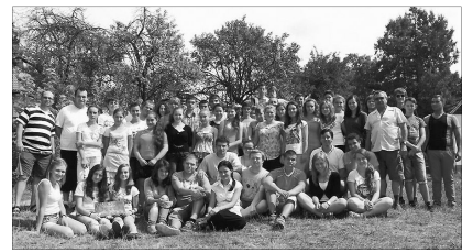
Szamosardó: Egyházmegyei ifjúsági tábor

✿ A rovatba szánt eseményképeket, legtöbb egy mondatos kísérszöveggel a harangszo@yahoo.com e-mail címre várjuk.