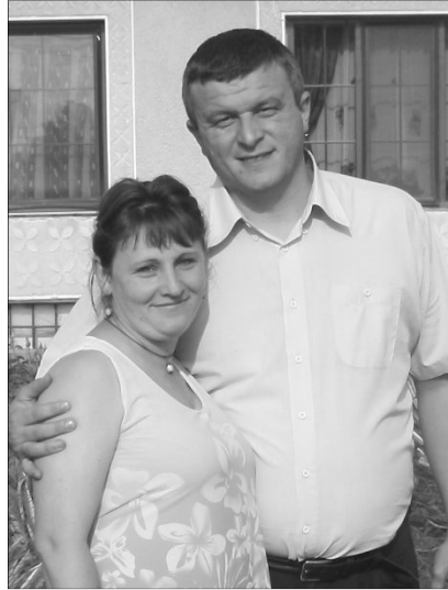
A Kátai házaspár reményekkel vágott neki életük új fejezetének

– Börvely nagy közösség, több mint 1200 lelkes református gyülekezet van itt. Úgy ismertem meg az itteni embereket,