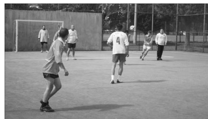
A szatmáriak küzdelme a vendéglátók ellenében.