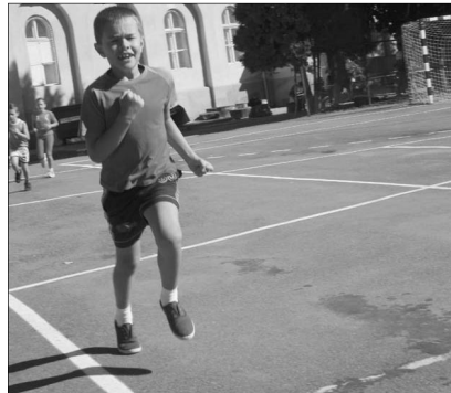
Az egyik kis versenyző

✿ ÉP A TEST, HA ÉP A LÉLEK – KÉT-SZÁZ FIATAL A SPORTNAPON. Sport-szerűségről, jókedvről, izgalmakról és frenetikus hangulatról szólt a Szatmárnémeti Református Gimnáziumban megrendezett egyházkerületi sportnap, ahol négy egyházmegye (Bihar, Szilágysomlyó, Érmellék és Szatmár) húsz gyülekezte képviseltette