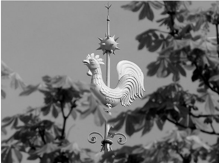
„Reformációra nem az istentelnek van szüksége, hanem a hívőnek.”