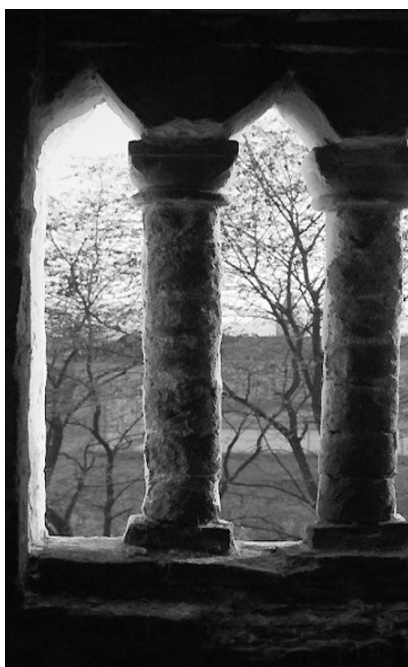
Tájkép a toronyból