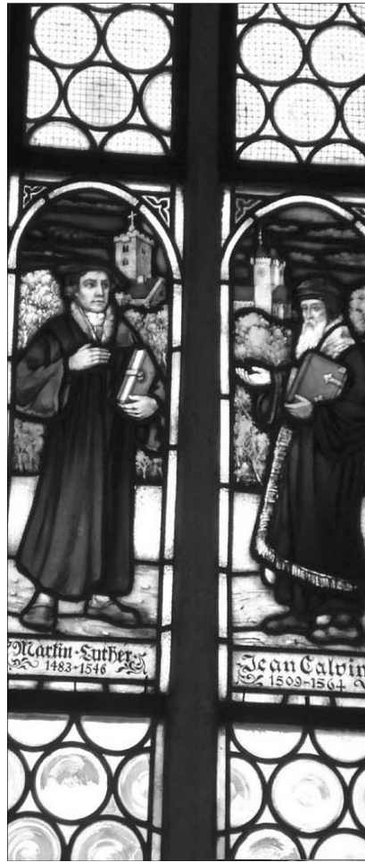
„A reformáció meghatározó hitünk és erkölcsi életünk megélése szempontjából”

Lásd, téged sem kerül ki Jézus, neked is kínálja az élő vizet, amit te csak szintén, lelki rútságodat el nem takarva fogadhatod el!