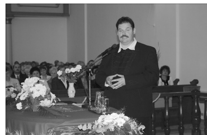
Az alcsúti presbiter