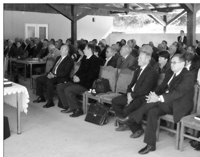
Solyomkővári konferencia. A magyarságnak sorsa és küldetése van a Kárpát-medencében

masági történelemtanár tartott a magyar nemzet- és küldetésstudatról, azon belül a Szent Korona rejtélyéről. Előadásából kitént, hogy elkötelezetten hisz abban, hogy a magyarságnak sorsa és küldetése van a Kárpát-medencében. Az ősmagyarok küldetés-tudatában már ott volt az egy és igaz Istenbe vetett hit.