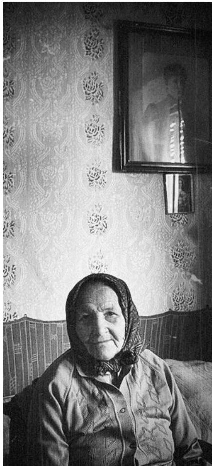
„Az öregség a gyümölcstermés korszaka”

Ez a látás egyre inkább az élet Urára, kegyelmes Istenünkre emeli tekintetünket. Az élet az Ő ajándéka, mi pedig hatalmának és atyai szeretetének megajándékozottjai va-