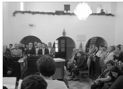
Kétszáz éves a borossebesi református templom