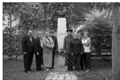
Segítségnyújtók és vendéglátók, a tenkei Kossuth-szobornál