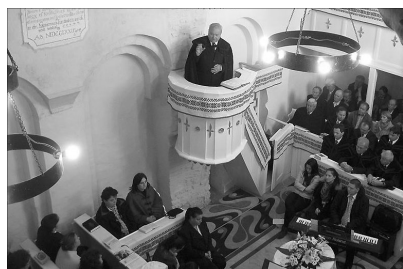
Hálaadó ünnep Somlyóújlakon

Mindezért Istené legyen a dicsőség, aki nemcsak a kőből épített templomokat, de az emberi lelkeket is kész megújítani. Ebben bízva énekelte hálásan és tiszta szívvel a templomból kivonuló ünneplő sereg a 153.