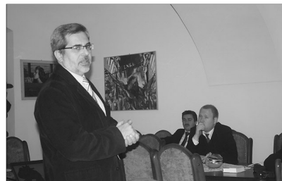
Az Istennel való közösségnek gyógyító hatása van