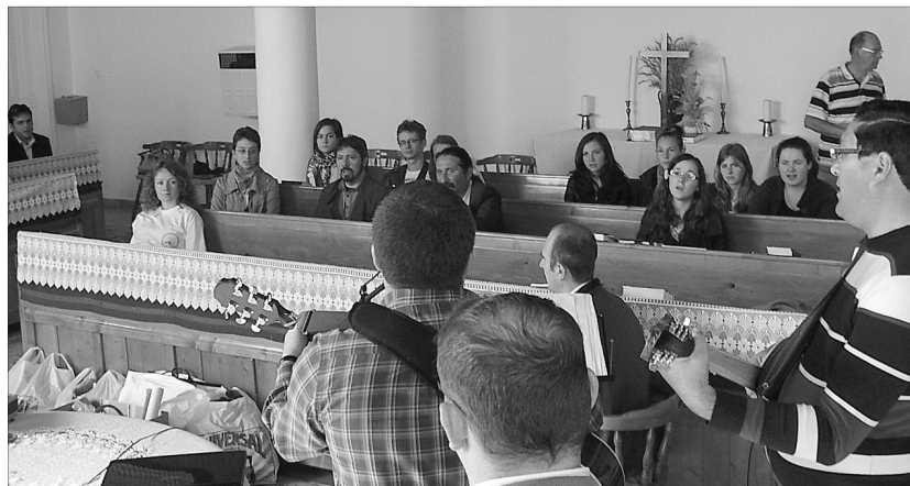
„Egy közösségben a dolgok nem velem történnek, hanem általam”

Az idei év októberében az angyalkúti református gyülekezet adott otthont a Királyhágómelléki Egyházkerület őszi ifjúsági találkozójának. Az Angyalkútra érkező ifjakat és vezetőiket a helyi református ifjúság tagjai, lelkipásztorok és annak felesége, valamint a helyi asszonyok fogadták nagy szeretettel.