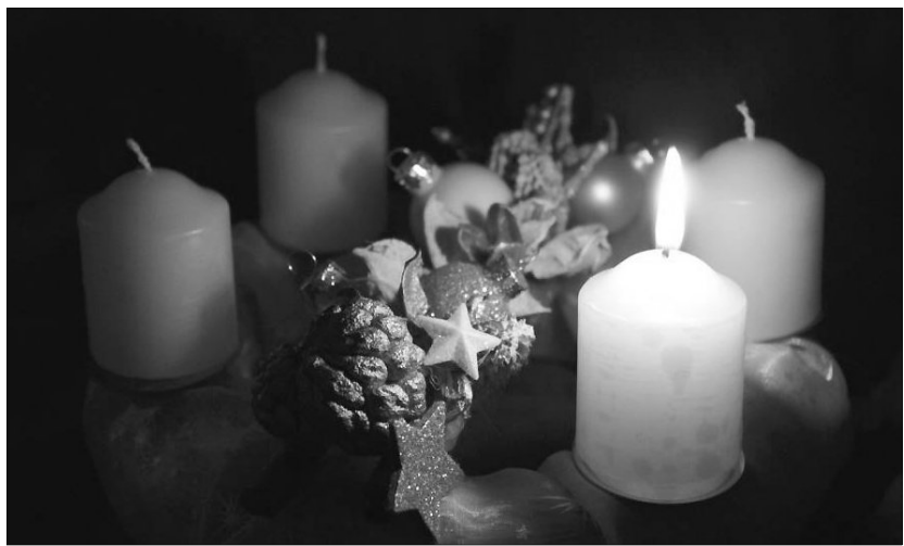
„Istennek is van adventje, vár arra, hogy hozzá kiáltunk”

Az adventi időszak arról szól, hogy várjuk az Urat, de íme, Ő is vár minket. Ahogy Péter írja: látszólagos késése, tudniillik az, hogy még nem jött el, annak a jele, hogy még hosszan túr érettünk . Vigyázz, mert Isten türelme hosszú, de nem végtelen, egyszer lejár a kegyelmi idő, ma még nyitott ajtót adott élénk (Jel 3,8), de ez az ajtó egyszer becsukódik.