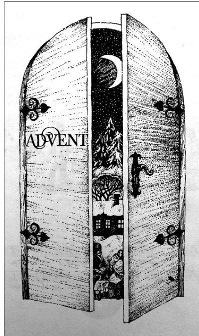
„Igyekezzen Jézus eljövételére lelki szemekkel figyelni”

Az igeversben arról olvasunk, hogy a pap felesége, Erzsébet, Szentlélekkel telt meg. Ellentmondásosnak tűnik, hogy a pap felesége, aki istenfélő életet élt, eddig nem volt betelve Isten Lelkétől? Hogyan lehetséges ez? Lehet Lélek nélkül istenfélő életet élni?