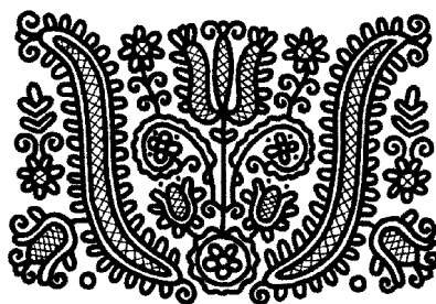
Radványi Károly alkotása

a hitről való gondolkodást, a tanról való értekezést pedig hagyja a szakemberekre, a lelkészekre. Nem állja meg tehát a helyét az a felfogás, hogy a gyülekezeti előjárónak csupán olyan ismeretekre van szüksége, melyeket a gyülekezeti gyakorlatban használhat fel. Különösen akkor, ha ez a gyülekezeti gyakorlat kimerül az egyházfenntartó járulékok, a „papbér” begyűjtésében, és a falinaptár kiosztásában. Ha a presbiter lelki-