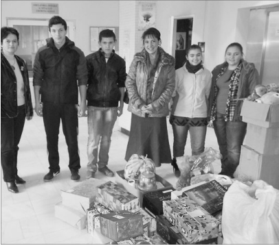
Isten vigasztalását hirdelve, ajándékokkal keresték fel a gyermekkórház kis betegeit