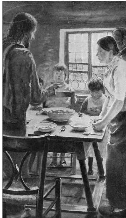
Uhde Frigyes: Jézus Urunk, légy vendégünk

Eszembe jut néhai operai életmemnek egy kis epizódja. Egy csinos, jó termetű szubrett Cherubint énekelte a „Figaró”-ban. Új jelmezt kapott. Rokokó apródruhát. A rokokó nadrágot térd alatt fogja össze egy kis pánt. Könyörgött, hogy vágassam rövidre a nadrágját, hogy csinos térdeit mu-