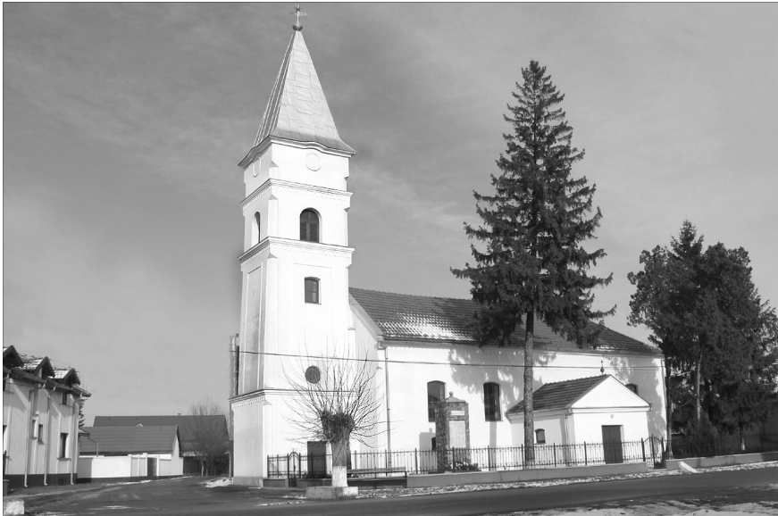
A borsi református templom. 2012-ben Pro Ecclesia-díjban részesült az egyházközség