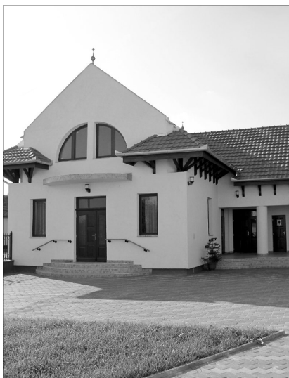
Az impozáns gyülekezeti ház

A gyülekezet egy része ragaszkodott egyházához, más része kevésbé. Molnár