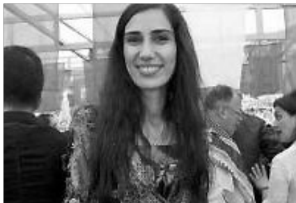
HITBELI DÖNTÉS VOLT