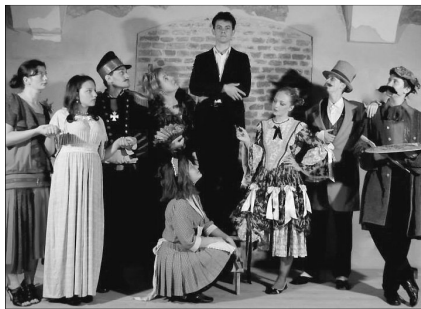
A NAGYVÁRAD-VELEENCEI SZÍNJÁTSZÓ CSOPORT

– Eddig nyolc darabot mutattunk be, és mindegyik kimondottan keresztyén- és evange-