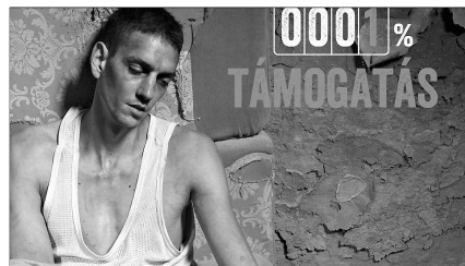
MAGABIZTOS ÜZENET A VILÁGHÁLÓN

A református egyház jól szerepelt a tavalyi Hipnózison is. Akkor a Társadalmi Célú Hirdetések között aratott. Elhozta a Print kategória harmadik helyezését az Egy asztalnál ülünk