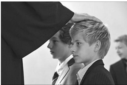
SZÜKSÉGES A SZEMÉLYES HITVALLÁS

A konfirmáció 475 évére tekintenek vissza ebben az évben Németországban. A konfirmációt 1539-ben Hessenben vezették be először, ámbár Luther Márton eleinte egyáltalán nem lelkesedett érte.