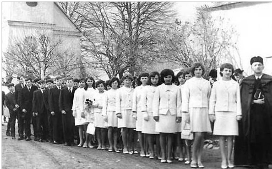
AZ EGYÜTT MEGVALLOTT HIT NEMCSAK MEGERŐSÍT, DE AZ ÉLETRE IS FELKÉSZÍT

A konfirmáció nemcsak megerősítést, hanem elköteleződést is jelent. A konfirmációi istentisztelet az az ünnepi alkalom, amikor az ifjú/hajadon bizonyosságot, fogadalmat tesz a Krisztus, illetve az egyház melletti hűségéről.