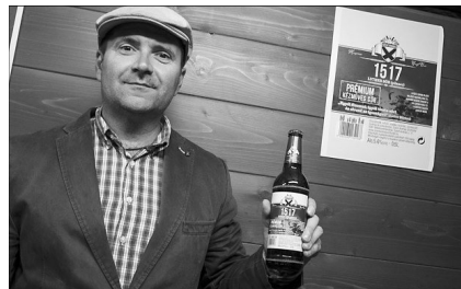
JÓ SZÍVVEL, DE CSAK MÉRTÉKKEL AJÁNLJÁK

Luther felesége sörfőző mester volt. Luther maga is nagyon szerette a sört, és el is várta a feleségétől, hogy készítsen neki. Azt is lehetne