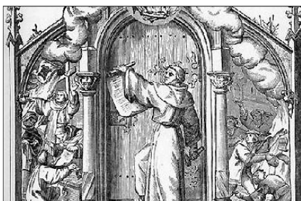
LUTHER MÁRTON KISZEGEZI 95 TÉTELET

A középkori egyház politikai és hatalmi igényei tetemes pénzüsségeket emésztettek fel, és a bűnbocsátó cédulák árusítása a pénzügyítésnek egy új módja volt. Luther Márton elsőként emelte fel szavát a katolikus egyház bűnbocsátat-árusítása ellen.