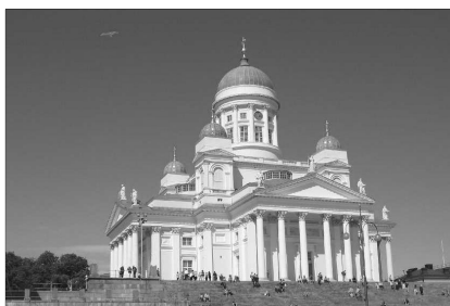
A HELSINKI EVANGÉLIKUS KATEDRÁLIS

Ugyanakkor az evangélikus egyház egy másik magas rangú vezetője kijelentette, hogy a parlamenti döntés nem változtatta meg a