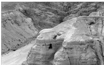
A QUMRÁNI BARLANGOK

Léteznek olyan vélemények, melyek szerint a korai keresztyének életmódja, tanítása és világszemlélete nem véletlenül hasonlít nagyban az esszénusokéra. Egyesek egyenesen azt feltételezik, hogy Jézus nemcsak hogy ismerte őket, hanem maga is esszénus volt, ám a Szent-